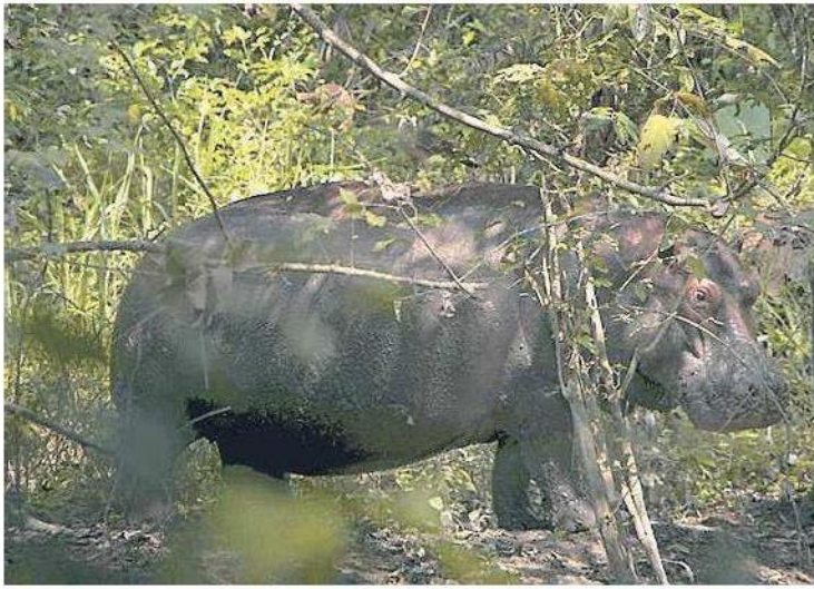
ANTEPRIMA Una scena del documentario «Pepe» del giovane domenicano Nelson Carlo De Los Santos Aria

DALL'INDUSTRIA DELLA PESCA IN IRAN AGLI AGRICOLTORI CHE NON VOGLIONO ABBANDONARE L'ISOLA DI MANDØ