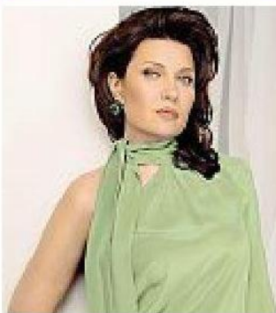
Soprano Marina Rebeka